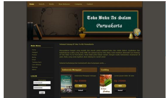
Gambar 2 Halaman Home

Berdasarkan metode yang telah dilakukan, maka diperoleh