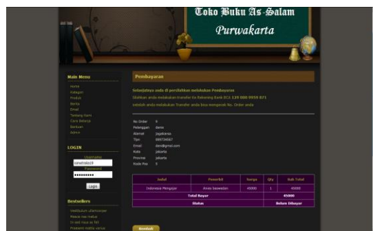
Gambar 4 Halaman Pemesanan